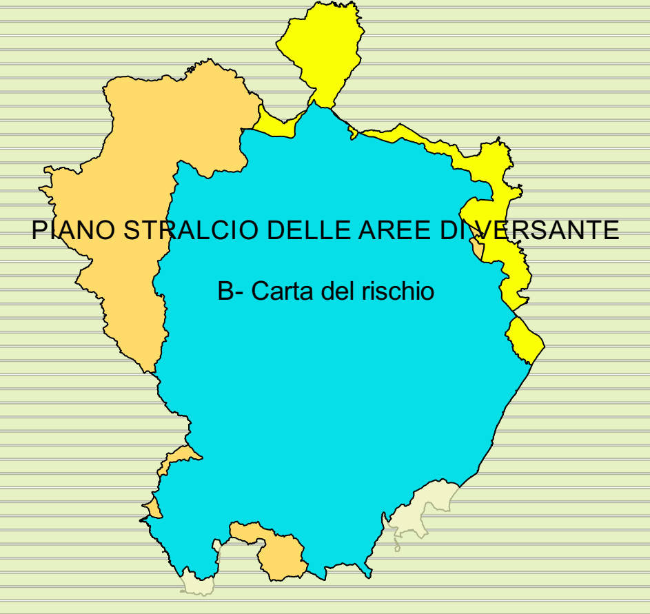
PIANO STRALCIO DELLE AREE DIVERSANTE B- Carta del rischio

Ristampa con aggiornamento dic. 2021 scala 1:25000 Tavola n. 11